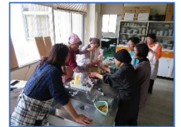
まずは試作をして本番へ