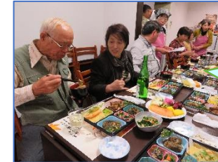
飯豊生まれの方と話がはずみました