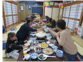
いちごクラブ旬の野菜で鍋パーティー(^▽^)/