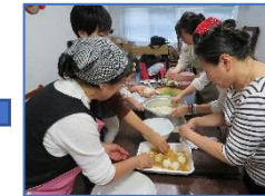
三種のぼた餅作り体験