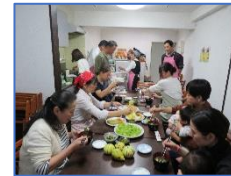
1日目はじんだん・味噌漬け・雑煮風体験と試食