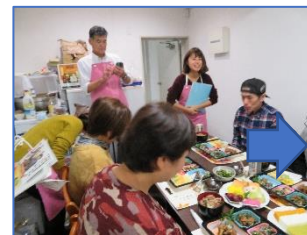
2日目は郷土料理を提供：(^^)なじみの方も